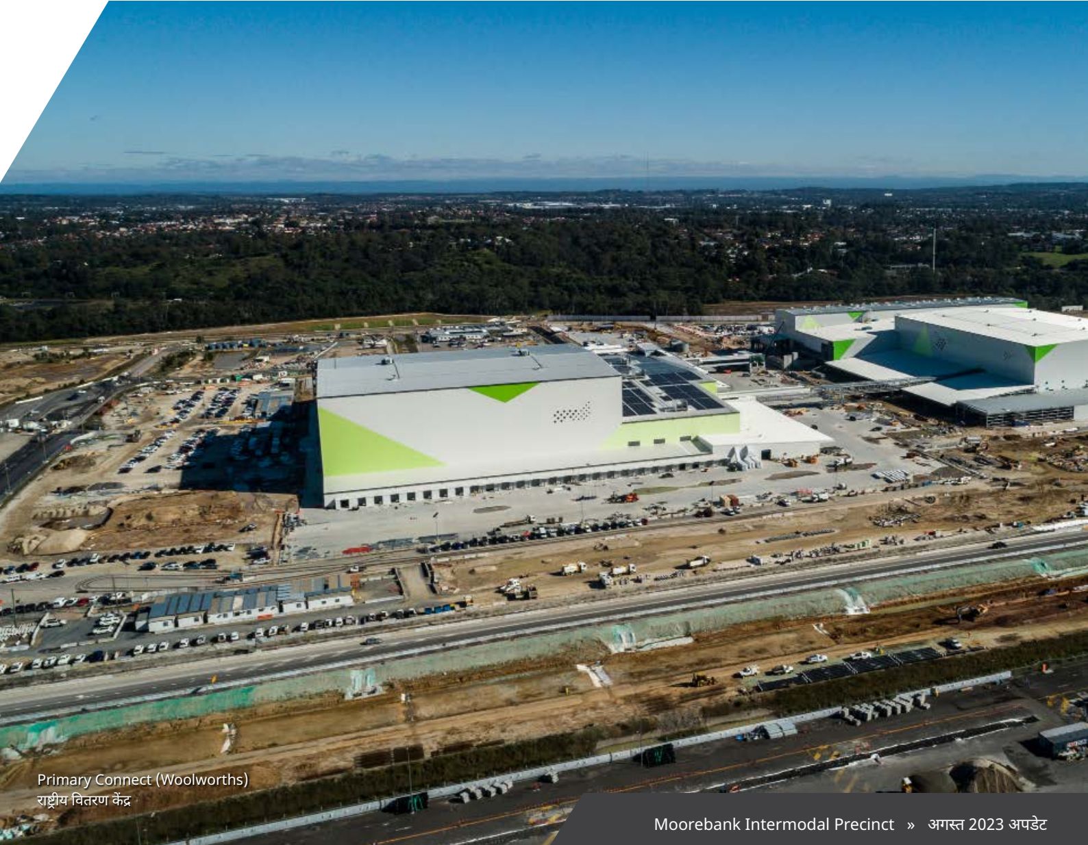
Primary Connect (Woolworths) राष्ट्रीय वितरण केंद्र