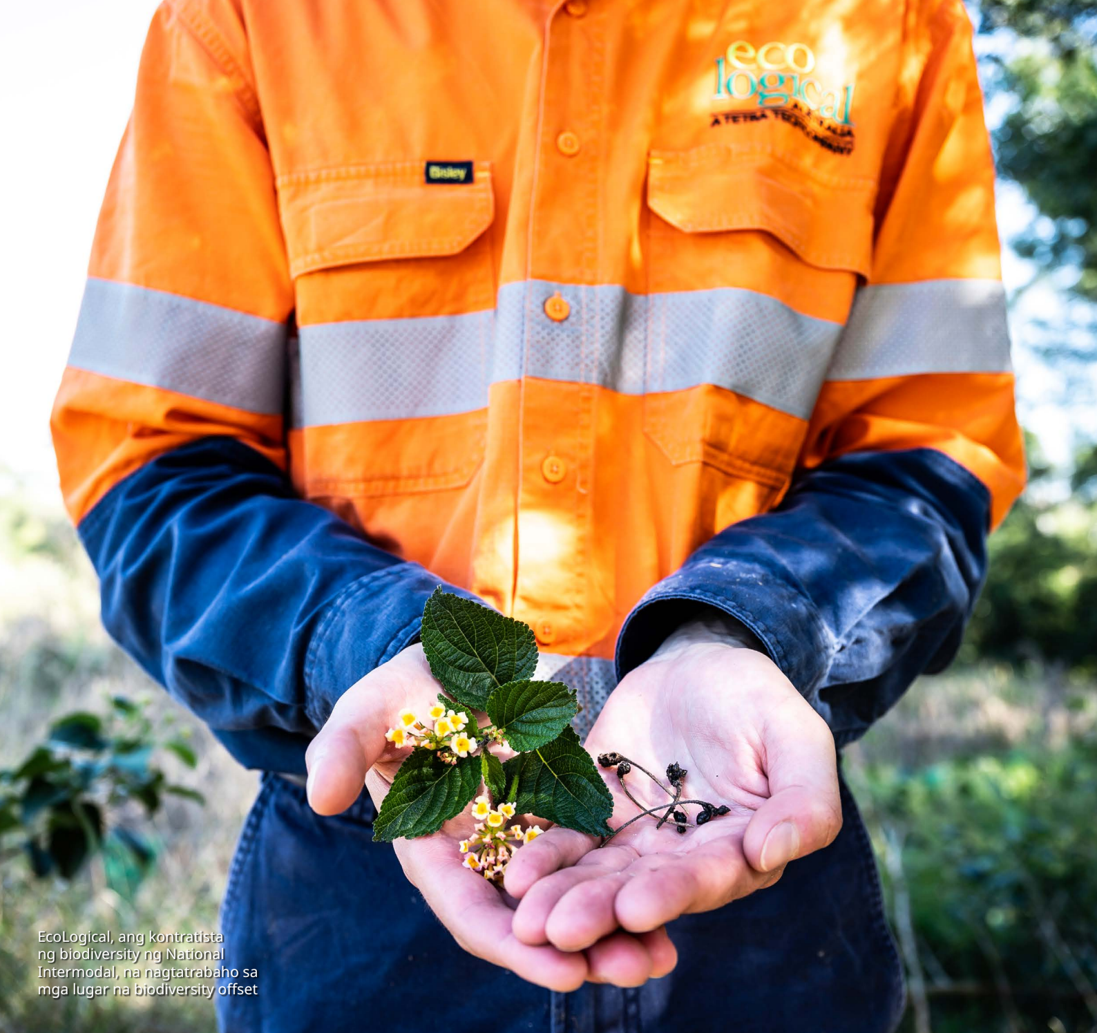
EcoLogical, ang kontratista ng biodiversity ng National Intermodal, na nagtatrabaho sa mga lugar na biodiversity offset