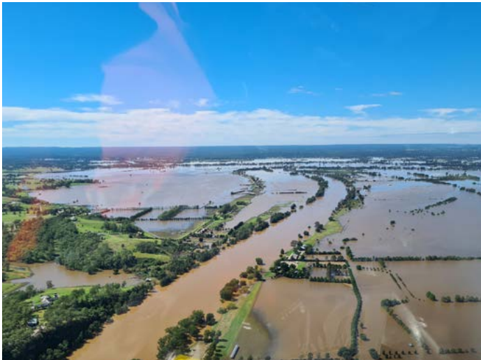
Hawkesbury River, Richmond