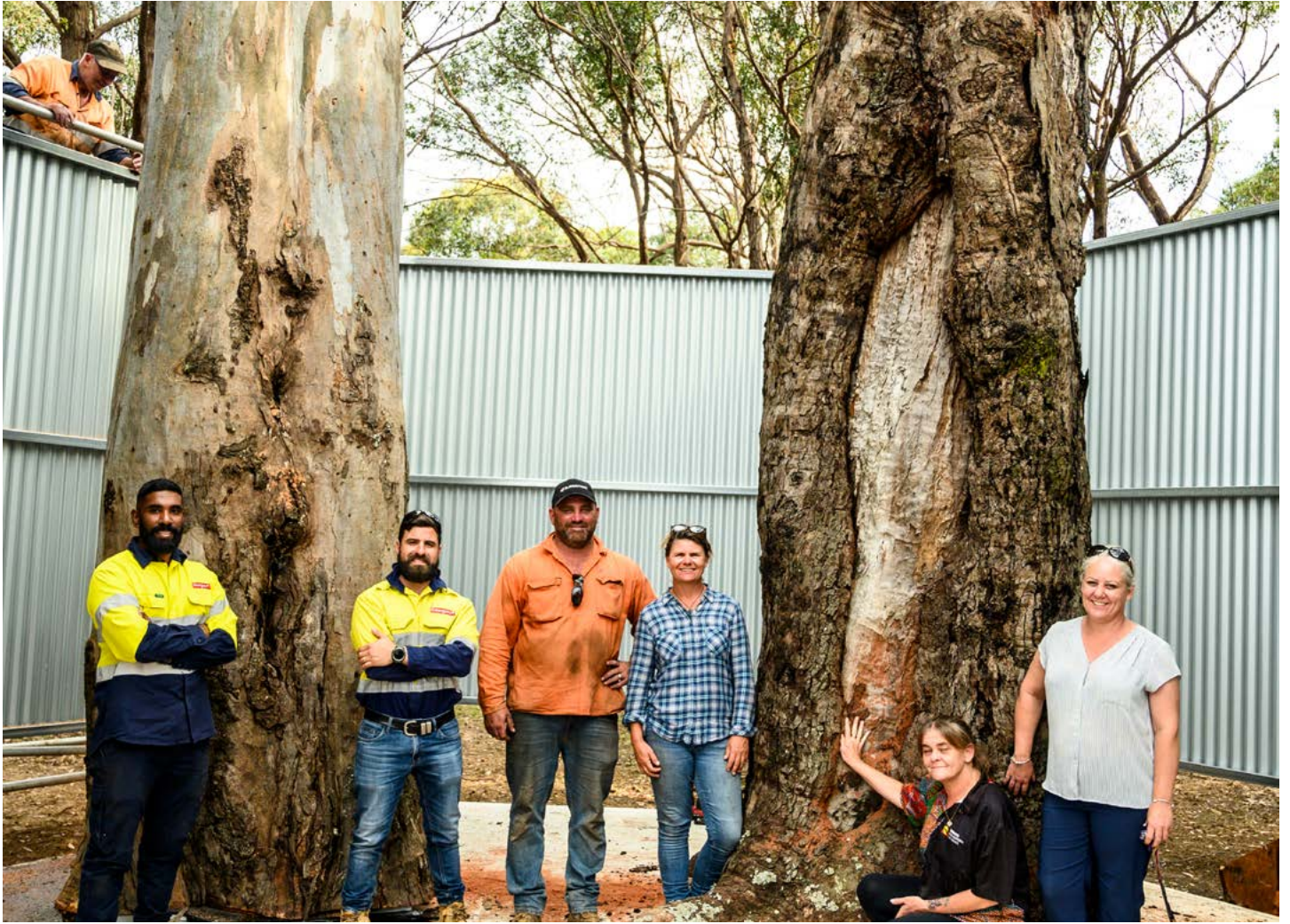
Ang aming mga Rehistradong mga Partido ng Aboriginal ay nasa site noong Nobyembre upang pangasiwaan ang paglipat ng dalawang mga Scarred Tree, na naging pagmamay-ari ng Tharawal Land Council.