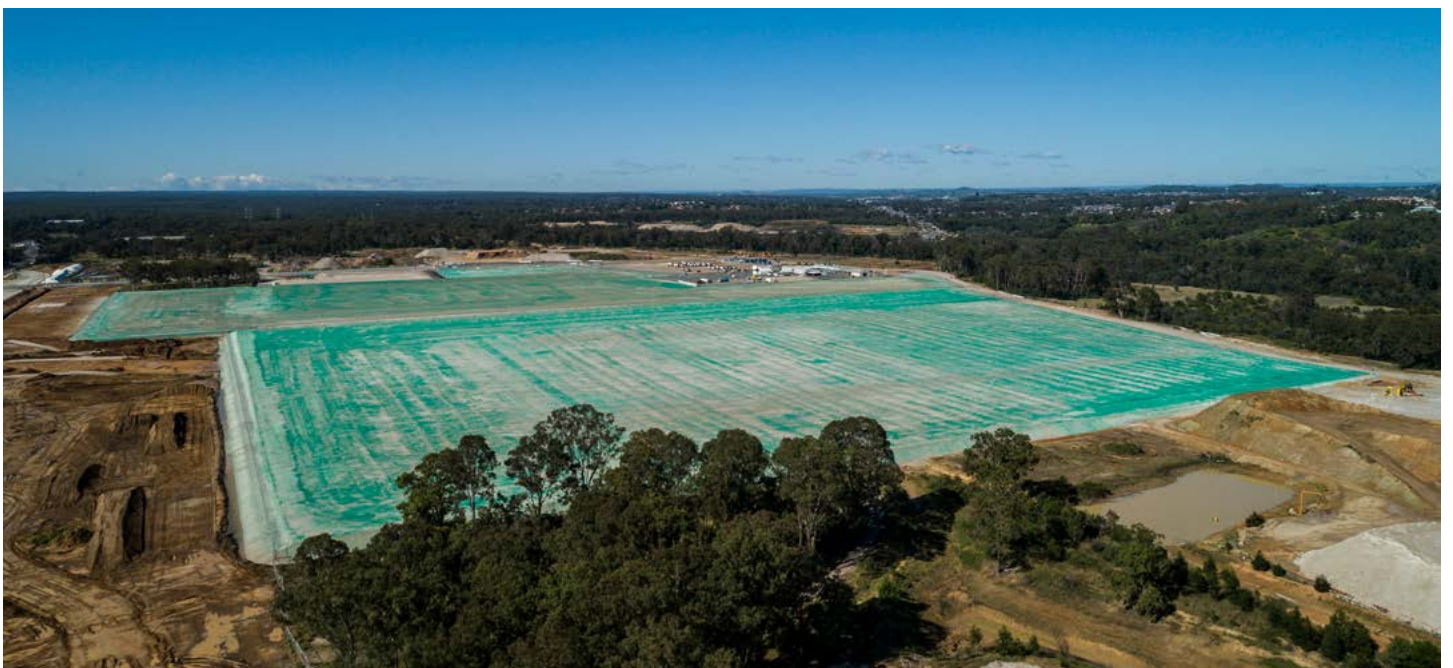
Isang makabuluhang pinag-ukulan ng aming trabaho sa Moorebank Precinct West noong 2020 ay ang paghahanda ng lugar para sa dalawang bagong distribution centre ng Woolworths, na sasakup sa isang makabuluhang bahagi sa gitna ng aming site - sa tabi ng padating na interstate rail terminal.